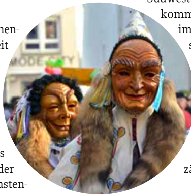
Auch kulinarisch geht's während der fünften Jahreszeit im Südwesten deftig zu.

Saure Kutteln oder Nierle sind beliebte Gerichte, die im Südwesten nicht nur zur Fasnachtszeit auf den Tisch kommen. Eine besondere Form der Kutteln gibt es im Oberschwäbischen Riedlingen. Hier trifft man sich jeden Fasnachtsdienstag im Rathaussaal zum Froschkuttelschmaus. Aufgetischt werden allerdings keine Frösche, sondern Innereien vom Rind, die mit Rotwein und Gewürzen verfeinert wurden. Der Name „Froschkutteln“ ist der Legende nach entstanden, da Riedlingen als Storchstadt gilt und zu den Leibspeisen des Federviehs Frösche zählen.